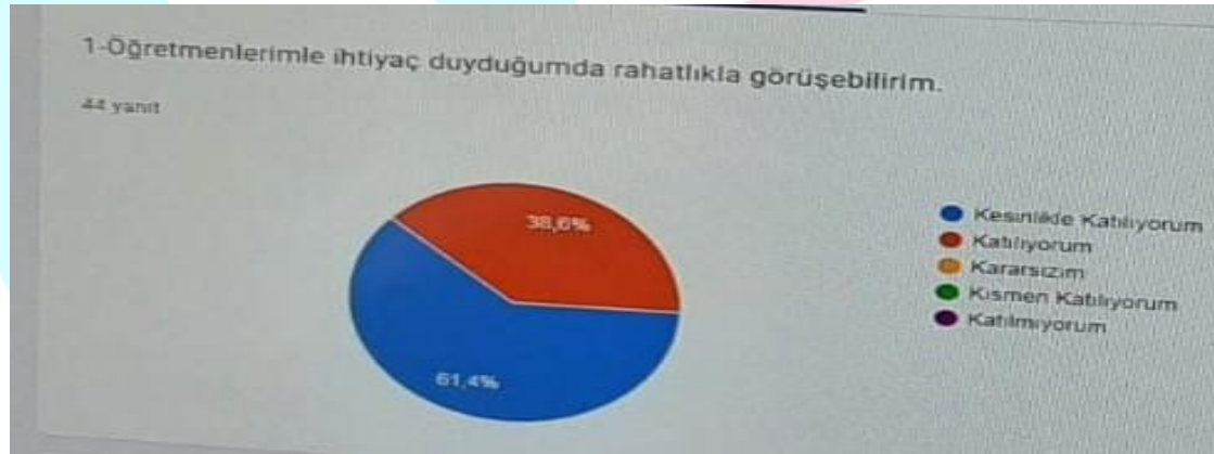
Şekil 1: Öğrencilerin Ulaşılabilirlik Düzeyi

Okulumuzda toplam 197 öğrenci öğrenim görmektedir. Tesadüfi Örneklem Yöntemine göre seçilmiş toplam 44 öğrenciye uygulanan anket sonuçları aşağıda yer almaktadır.